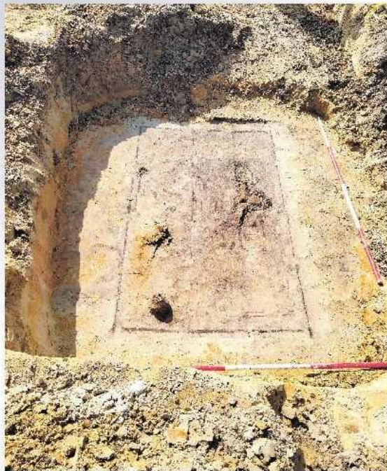
Een kamergraf met houten kist, waarvan de sporen van de planken nog te zien zijn.

Op basis van de bijgaven kan voor een aantal graven al tijdens de opgraving worden bepaald of in de kist een man (15 x) of (jonge) vrouw (21 x) lag. Voor de meeste graven (84 x) is dat nu op basis van de vondsten nog niet mogelijk, dat volgt later bij de reiniging van de vondsten en de uitwerking van de gegevens. Een deel van de graven moet zelfs nog worden opgegraven. Kleine graven zijn ongetwijfeld kindergraven (22 x). In deze graven worden vaak 1 tot 2 kraakjes teruggevonden. Van de skeletten zelf is nog maar weinig bewaard gebleven. Dit komt doordat op de zure zandgronden het bot volledig oplost. Soms wordt de plek van de schedel of de benen en armen nog herkend