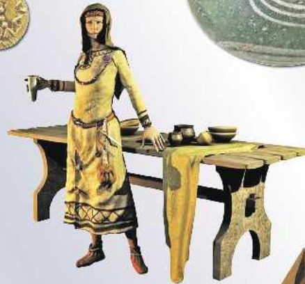
Reconstructie van een 'Frankische' vrouw met haar persoonlijke eigendommen, teruggevonden in haar kistgraf in Wychen. (Illustratie: Mikko Kiek - © BCL en Hazenberg Archeologie)