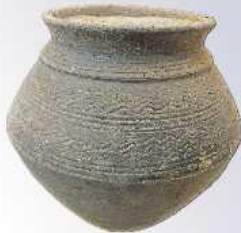
Een aardewerken pot met banden met ingekaste golflijnen uit een van de graven (ca 15 cm hoog).