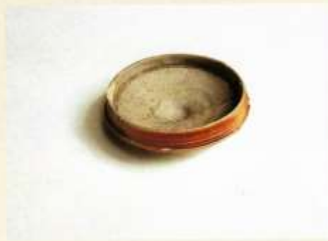
Drinknap uit Siegburg (Duitsland), 15 e / 16 e eeuw