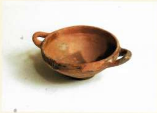
Twee-oren kom van aardewerk, 16 de eeuw