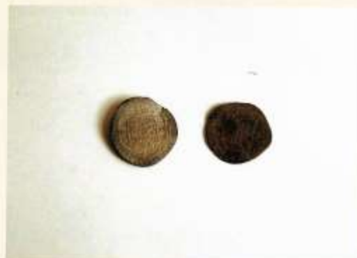
Bodemvondsten uit de opgravingen van de Oude Pastorie