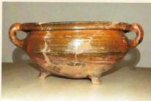
Kookpot of grape, ca. 1550. Afkomstig uit slootvulling naast de funderingsmuur