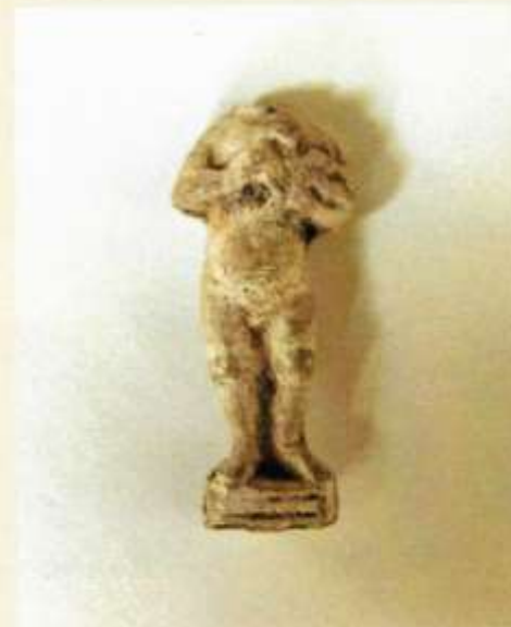
Bodemvondsten uit de opgravingen van de Oude Pastorie