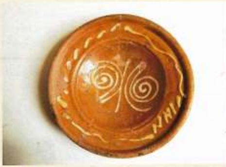
Schotel met slibversiering, 2 e helft 16 e eeuw