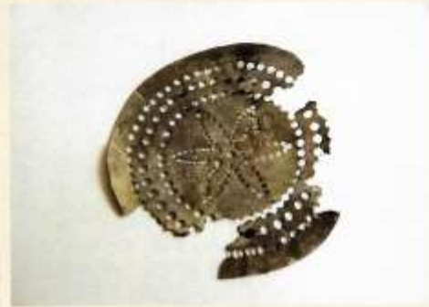
Koperen schuimspaan, 16 e eeuw