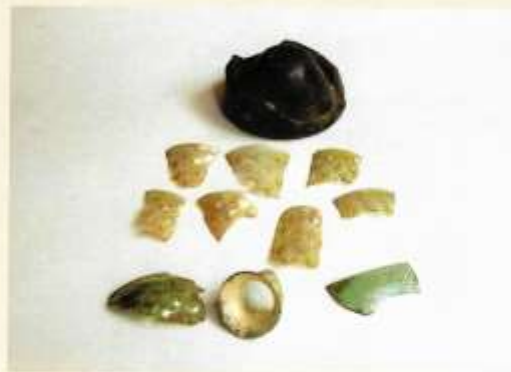
Glasfragmenten 16 e eeuw