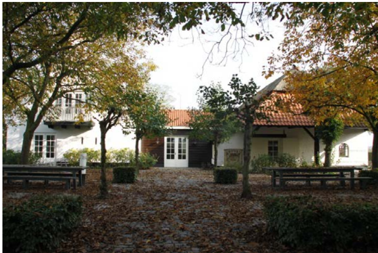
Op de plaats van de latere In 'd Ekster stond in de zeventiende eeuw de brouwerij

Eerder genoemde Jan Jacob Hoosmans trouwde op 12 juni 1706 met Cornelia Hackens. 16 Op 10 november 1713 had deze Jan Hoosmans in de Westerwijk een huis met aanstede groot 32 loopse gekocht. Daar werd hij vanaf 1717 als tapper vermeld. 17 Jan stierf op zaterdag 8 april 1719. Zijn weduwe bezat in 1720 vier koey en een peert . Op 21 januari 1721 werd de inventaris van de roerende goederen opgemaakt, waarbij de vermelde artikelen ketels, kuipen en bierboom uiteraard bij een brouwerij horen. Cornelia Hackens, weduwe van Jan Hoosmans, hertrouwde op maandag 3 februari 1721 met Cornelis van Trier, die eerder weduwnaar was van Jenneken Hendricx en van Maria Schellekens. In 1717 werd Cornelis van Trier reeds als tapper in de Westerwijkse lijst genoemd. Dat was hij ook nog op 1 oktober 1734 en 1739 en hij werd voor de 'bierimpost' voor 16 gulden aangeslagen. Tegelijkertijd werd hij met 18 gulden in de lijst voor het 'geslacht' voor twee verckens genoteerd. Zijn veestapel bestond uit 'zes hele en twee halve beesten' en hij bewerkte 20 loopse land in 5 percelen. 18 Volgens de bewoningslijst van 1756 werd Jan Roelof Jansen de nieuwe bewoner van de boerderij van de kinderen Cornelis van Trier, waar hij ook tapper werd.