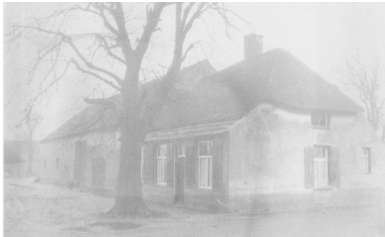
Verdwenen oude herberg in de Grote Westerwijk genaamd 'Voor in en achter uit'