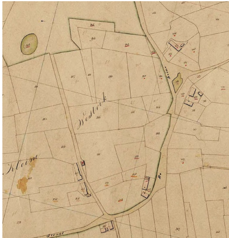
Kaartje van de Kleine Westerwijk omstreeks 1830 met plaats voormalige oude brouwerij (1)