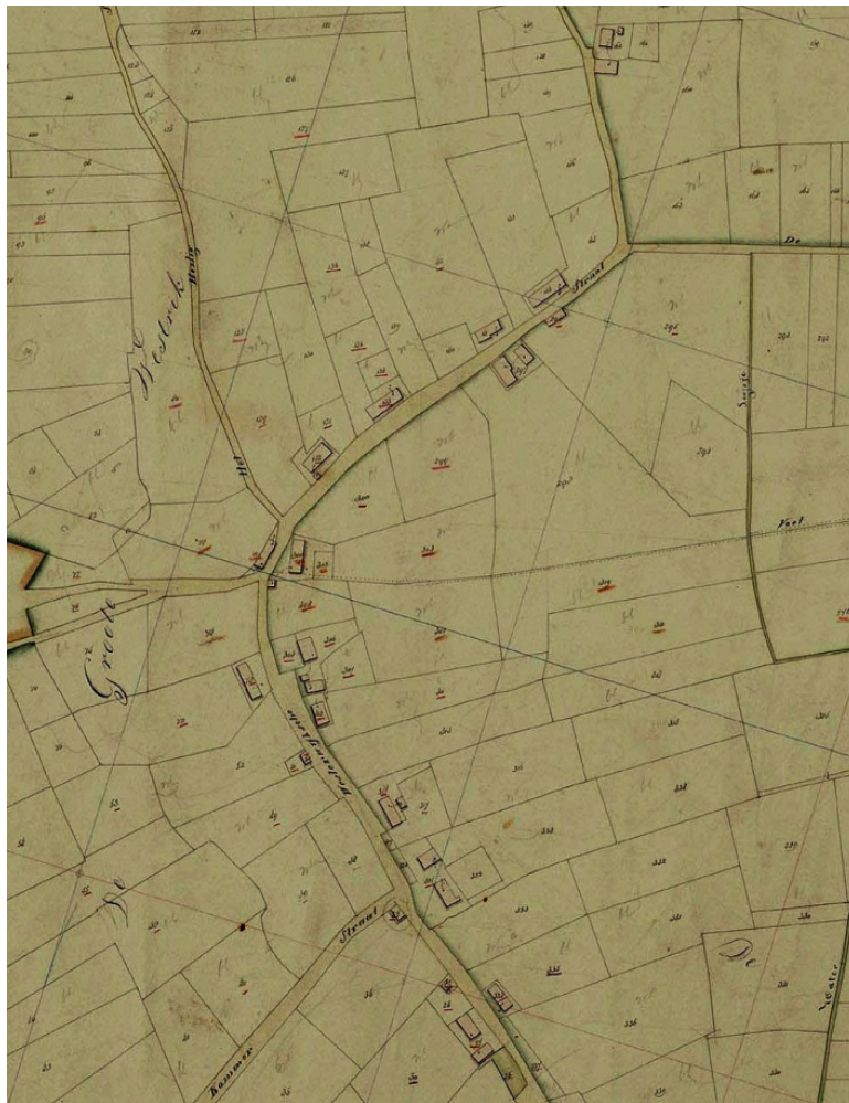
Grote Westerwijk in 1828 met oude herberg (1) en tolhuisje (2)

genadeslag gegeven had, omdat hij de kaarten aan het oprapen was. Tijdens de visitatie van de chirurgijn kon het slachtoffer zich ook niets meer van het gevecht herinneren, vermits hij door den slagh met een keetelhoud bedwelmd ter aarde viel.