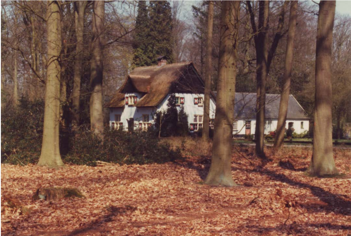
Plaats van de Tulderhoeve, waar Petronella Weygerde opgroeide en een groot gezin van 12 kinderen kreeg. Later werden er in Bladel nog twee kinderen geboren, voordat men naar Little Chute vertrok in 1863.