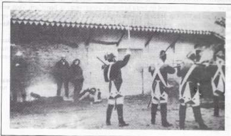
Opstandige Belgische boeren worden terecht gesteld door Franse soldaten. (Reconstructie executie in 1898)

Het gemeentebestuur reageert zeer snel. Daags daarna stuurde zij reeds een antwoord.