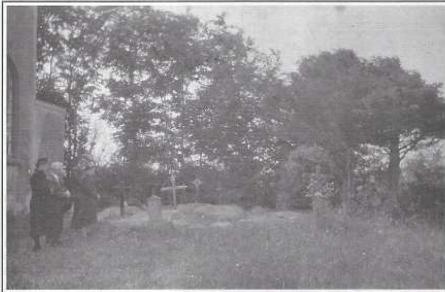
Foto onder: Weduwe en familie bij het tijdelijk graf van Jan Aarts in Grijskerke (juni 1940).

Die 14de mei capituleerde het Nederlandse leger na het bombardement op Rotterdam. Dit met uitzondering van Zeeland, waar men hoopte met geallieerde steun de strijd te kunnen voortzetten. Voor de in Zeeland teruggetrokken troepen werd de situatie daarmee niet minder chaotisch. In en rond Middelburg vonden schermutselingen plaats met per parachute neergekomen Duitse militairen. Vanuit bomen langs de grachttrand van de stad werd infanterist Jan Aarts diezelfde 14de mei door geweervuur dodelijk getroffen.